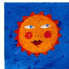
Le Plan soleil

Pour la seule année 2005, le marché a quasiment doublé par rapport à 2004 , avec plus de 100 000 m 2 installés en métropole (72,3 MWh). Au total, depuis 1999 et grâce au Plan Soleil, c'est une capacité de plus de 176 MWh qui aura été installée, soit plus de 250 000 m 2 de capteurs.